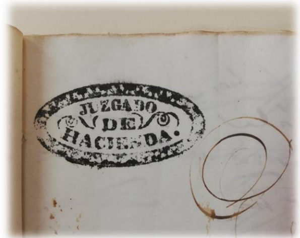
Ilustración 1 Sello del Juzgado de Hacienda, año de 1869. AGCA, expediente 310009, legajo 1273.

Para el caso del Ministerio de Hacienda, este representó, el ente que generara la justicia relacionada este fenómeno, todos los casos de fabricación, distribución y denuncias del aguardiente clandestino, era la causa su surgimiento durante el período conservador. Según Leticia González, las medidas contra el aguardiente y chicha clandestinos continuaron siendo parte de la legislación y en los primeros años de la década de 1850 se autorizó la creación de un resguardo de celadores 8 encargado exclusivamente de evitar la fabricación y venta clandestinas, cuyo salario estaba a cargo de los asentistas de cada jurisdicción. Esta medida no eximió a las autoridades regionales y locales corregidores, jueces, alcaldes, regidores y a todo empleado de policía de perseguirlas. La primera versión de la ley especificó que el resguardo funcionaría en los departamentos, pero en la siguiente se suprimió esta cláusula y el resguardo se extendió a todo el país, como es el caso de la ciudad de Guatemala.